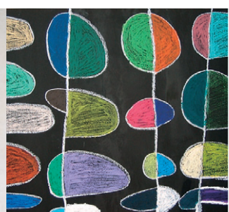
(左より) 田崎飛鳥「気仙沼の白鳥2」、森 陽香「きりん」、蒲生卓也「子ねこ」、伊藤峰尾「シーサー」、土屋康一「はっぴ」(部分)