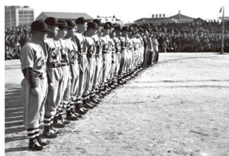
結成披露式でファンの前に初めて姿を見せたカープナイン (現 広島県庁周辺) 1950年(昭和25年)1月15日