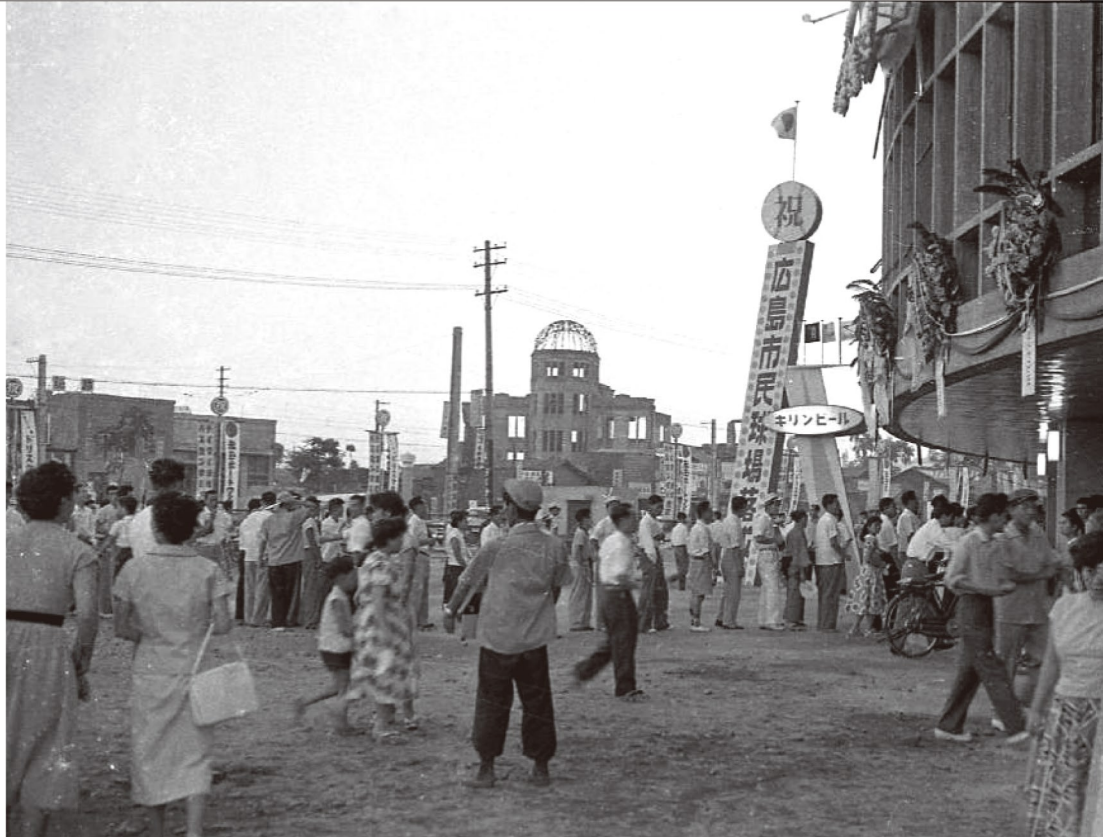
落成した広島市民球場。相生通りを挟み原爆ドームが見える 1957年(昭和32年)7月

1950年に誕生した市民球団は 開幕前から人材難、資金難に苦しんだ。 解散の危機を救うため、子どもは小遣いを 大人は生活費を削り、酒だるに入れた。 カープが好き。強いカープを見たい。 その熱い思いも一緒に込めた。 カープは危機を乗り越えた。街もよみがえった。 挑み続けるカープは市民の誇りとなった。 それ行けカープ、われらのカープ。