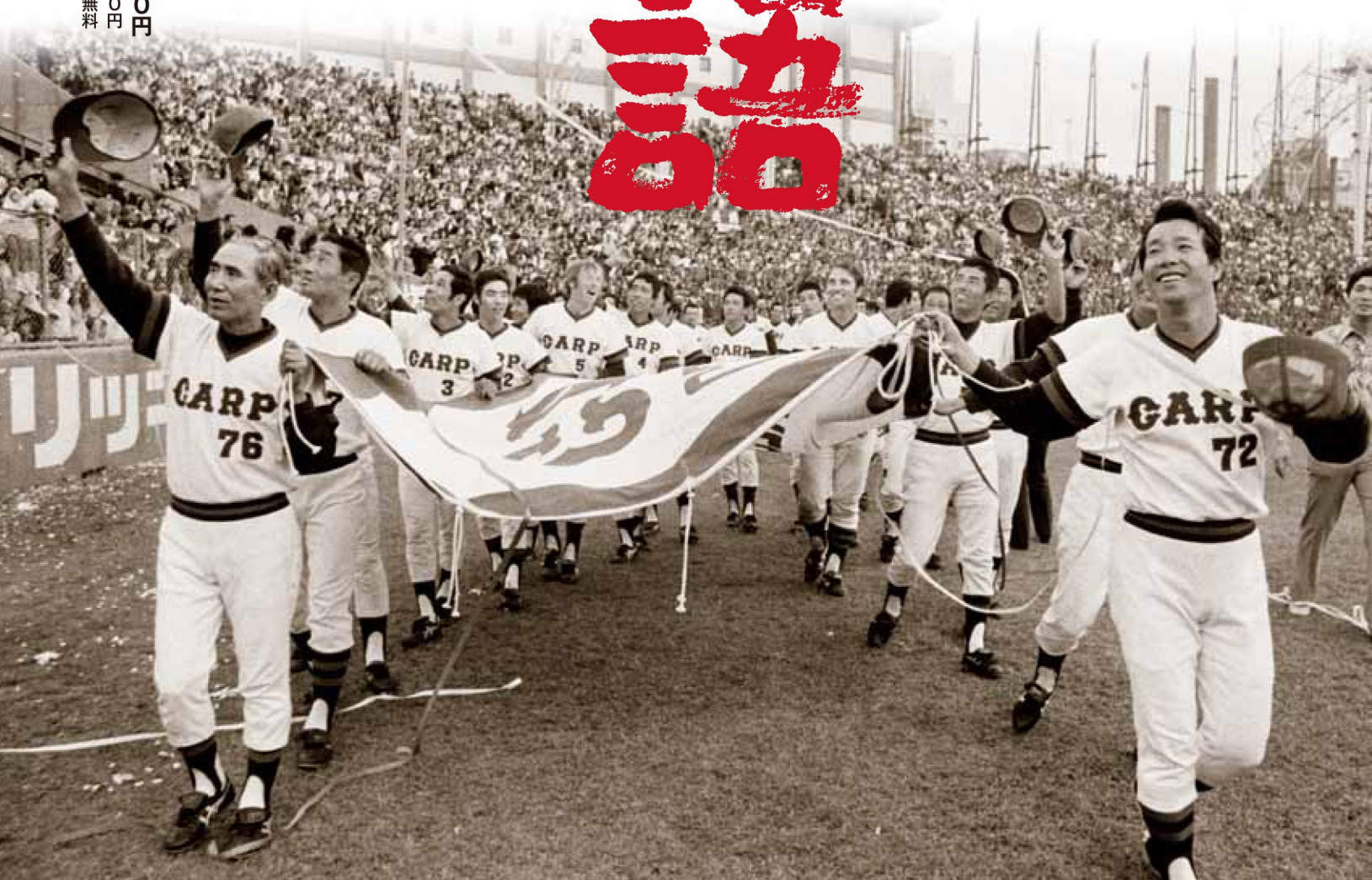
後楽園球場で巨人を4-0で下し、カープは球団結成26年目で初優勝を決めた。広島市民球場で最終戦を終え、チャンピオン・フラッグを先頭にグラウンドを一周するナイン 1975年(昭和50年)10月19日