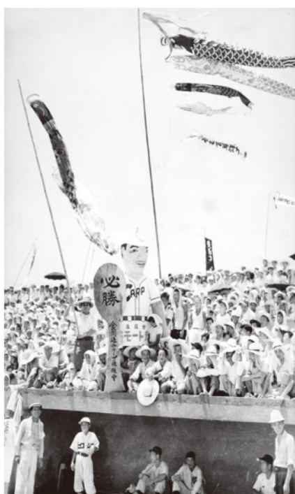
広島総合球場での試合前にあった後援会結成式で喜ぶファン 1951年(昭和26年)7月29日